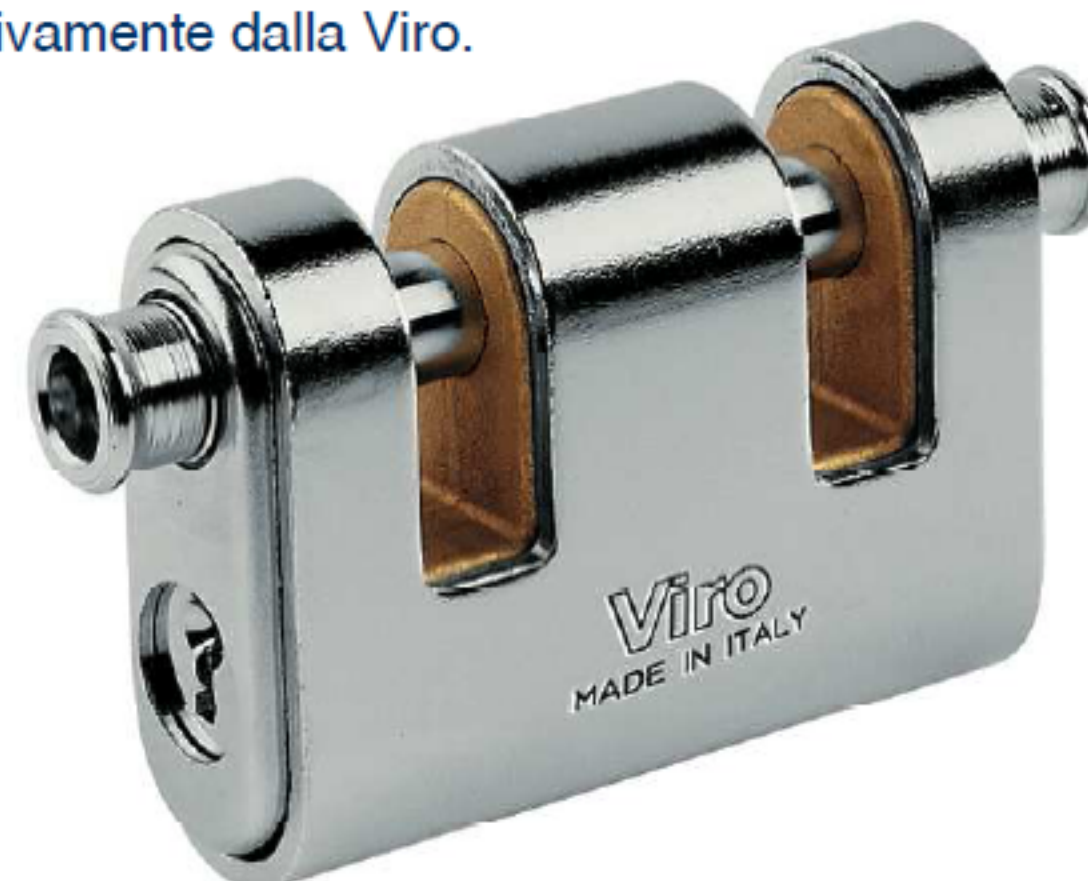
ASTE DI CHIUSURA INDIPENDENTI