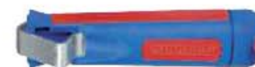
B 2186/41 gr. 8÷28 mm