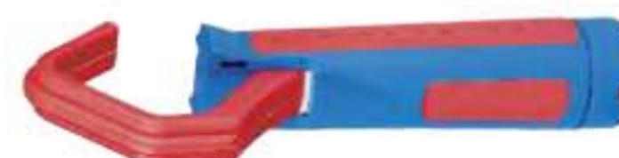
B 2186/41 gr. 35÷50 mm