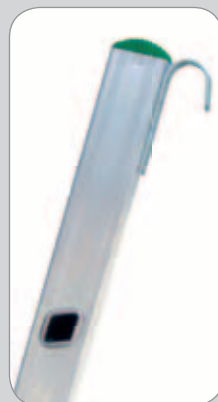
coppia di ganci leggeri

piede snodato grande con zoccolo d'acciaio ricoperto in gomma per montante 25x80 mm