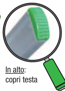
In alto: copri testa

PRIMA/S è scala singola d'appoggio in alluminio con pioli 30x30 mm a rombo inclinati di 68° che garantiscono l'appoggio in piano dei piedi ed il non affaticamento delle gambe (brevetto). La scala porta di serie, sotto i calzari, i fori per l'applicazione eventuale di piedi snodati.