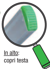
In alto: copri testa

PRIMA/S è scala singola d'appoggio in alluminio con pioli 30x30 mm a rombo inclinati di 68° che garantiscono l'appoggio in piano dei piedi ed il non affaticamento delle gambe (brevetto). La scala porta di serie, sotto i calzari, i fori per l'applicazione eventuale di piedi snodati.