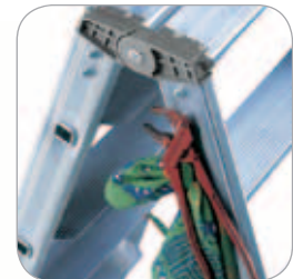
Pratico gancio porta attrezzi

È SCALA PROFESSIONALE DA LAVORO PER USO INTENSIVO