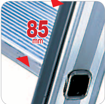
Gradini profondi 85 mm da ambo i lati