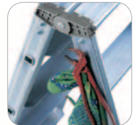
Pratico gancio porta attrezzi

È SCALA PROFESSIONALE DA LAVORO PER USO INTENSIVO