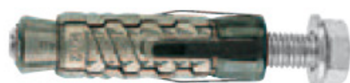
GM con vite TE cl. 8.8