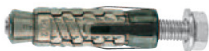
GM con vite TE cl.8.8