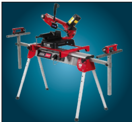
Segatrice motata su banco pieghevole "Multy" (art. 360 a richiesta)

Kit plan de travail et rapporteur (aussi pour art. 782XL/783XL SUR DEMANDE).