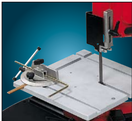
Kit piano di lavoro e goniometro (anche per art. 782XL/783XL A RICHIESTA).

Kit plan de travail et rapporteur (aussi pour art. 782XL/783XL SUR DEMANDE).