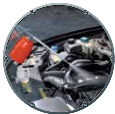
Motore coassiale con cilindro in ghisa Direct driven with full cast iron cylinder