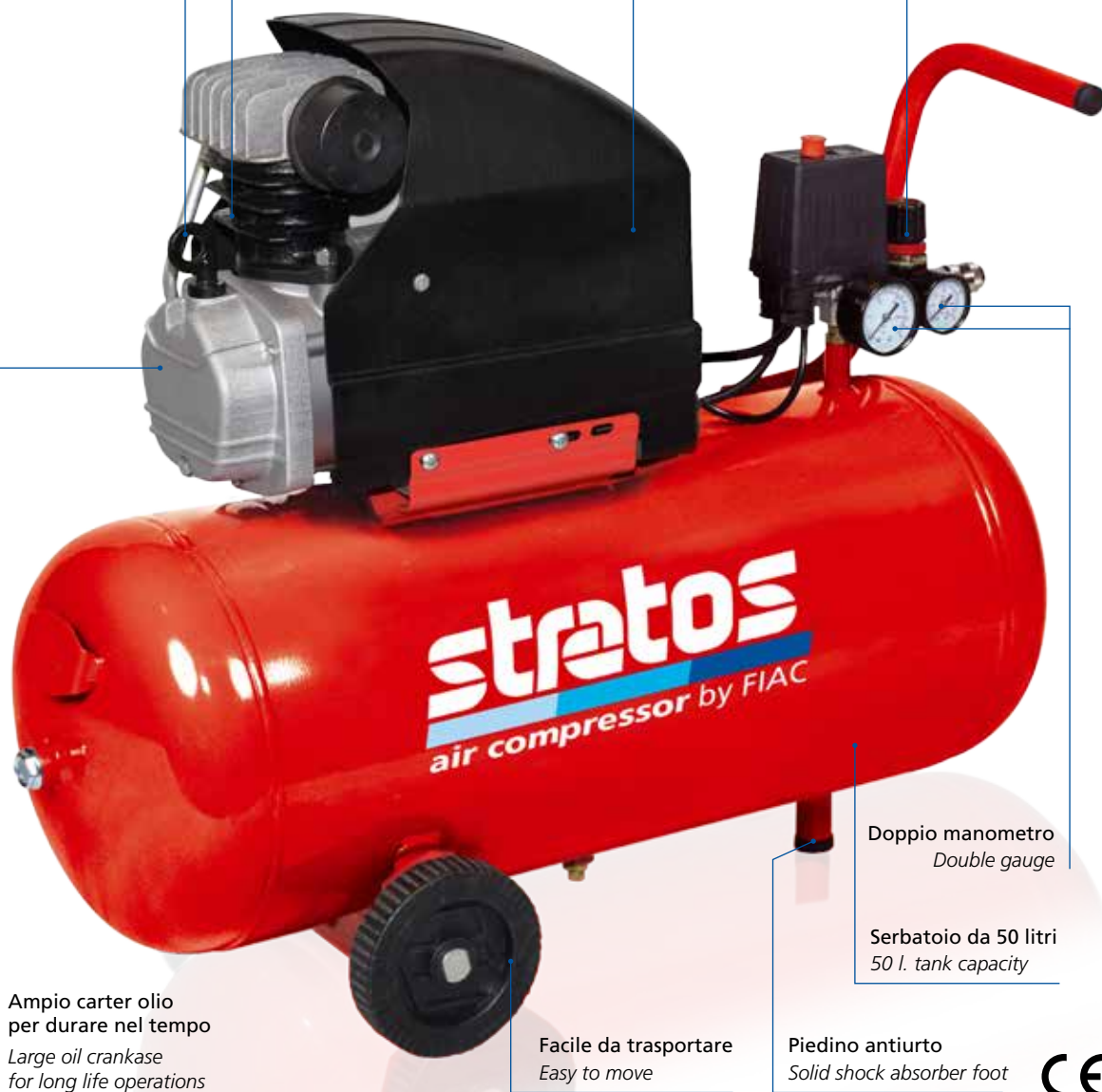
Doppio manometro Double gauge