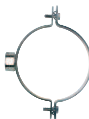
Collare zincato per tubi in polietilene con attacco da 1/2" e 1" gas CPE gas