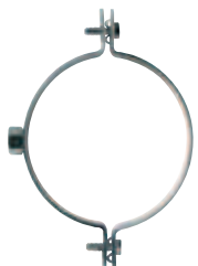
Collare zincato per tubi in polietilene con attacco M10 CPE-M10