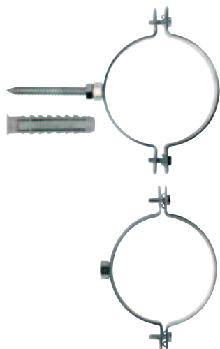
Collare zincato per tubi in polietilene completo di vite M10 e tassello ø 12 mm CPE-V